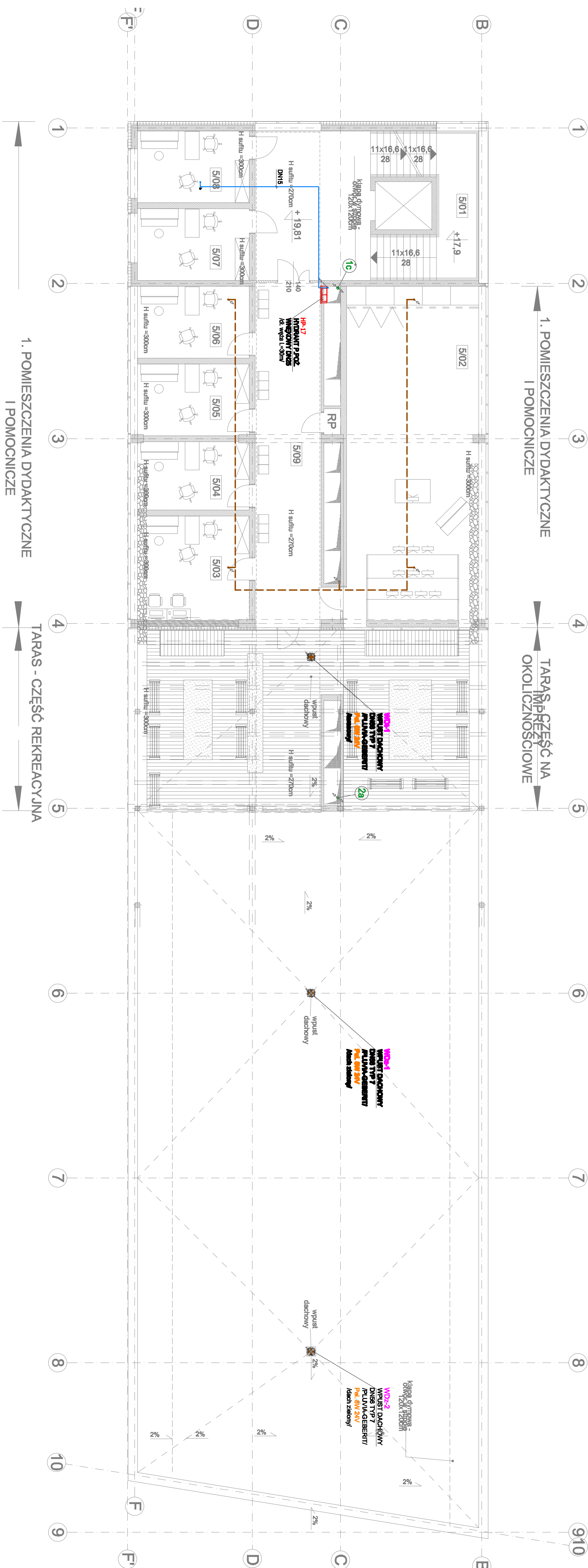
1. POMIESZCZENIA DYDAKTYCZNE I POMOCNICZE TARAS - CZĘŚĆ NA IMPREZY OKOLICZNOŚCIOWE